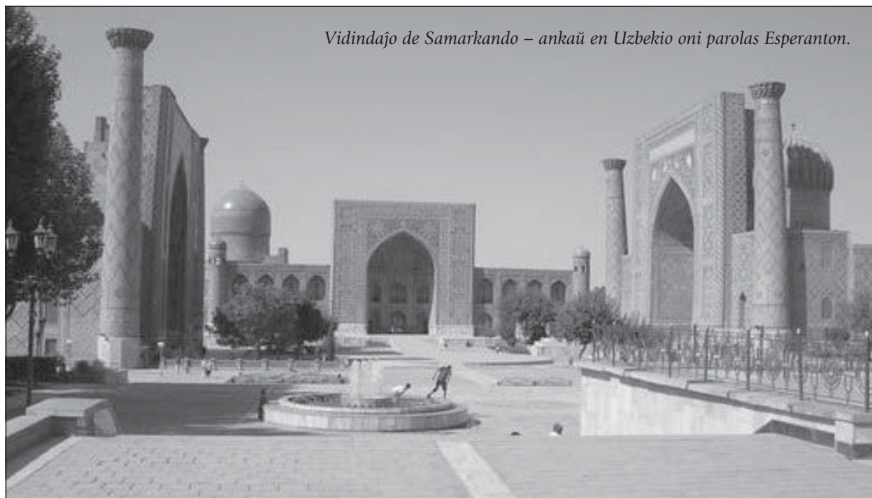
Vidindaĵo de Samarkando – ankaŭ en Uzbekio oni parolas Esperanton.